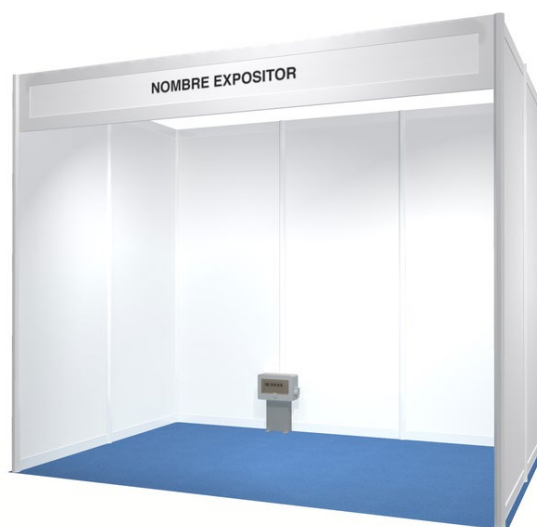
*Modelo de stand orientativo